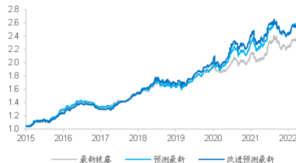
图5 中证 500 增强组合累计超额（2015.01-2022.04）