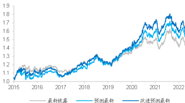
图4 沪深 300 增强组合累计超额（2015.01-2022.04）

由图 4-6 的累计超额收益可见，改进预测最新组合表现最优。相对而言，中证 500 增强组合的改善效果最明显，年化超额收益上升 1.1%（表 8）。