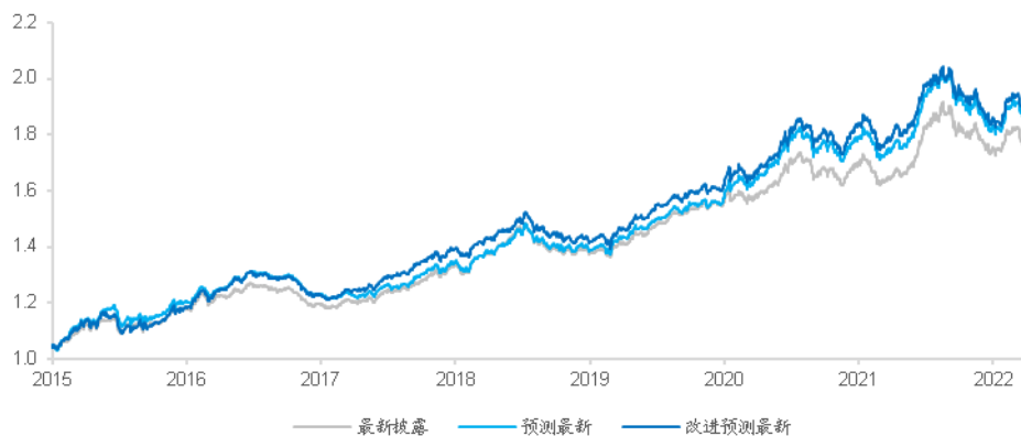
图6 中证 800 增强组合累计超额（2015.01-2022.04）